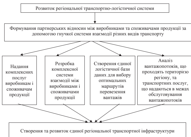
Рис. 2. Напрямки формування партнерських відносин у регіональній транспортно-логістичній системі