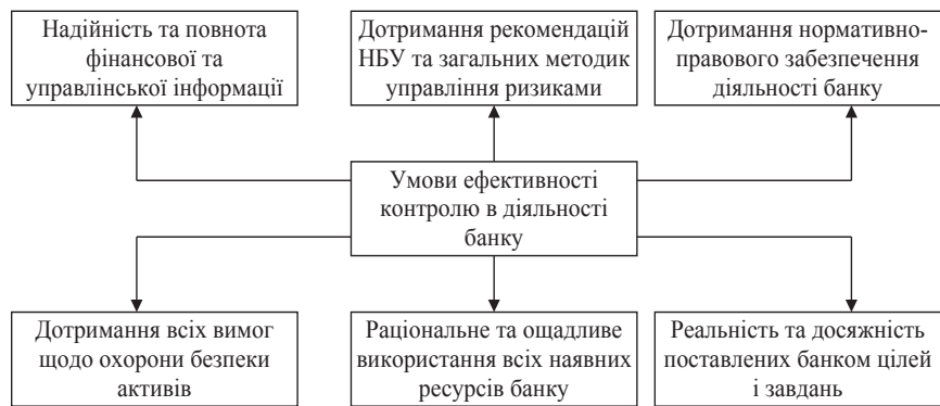
Рис. 2. Умови забезпечення ефективності контролю, як інструмента контролінгу банку

Наведені функції контролю дають змогу побачити, що він є надійним та дієвим набором засобів, професійне використання яких дозволяє керівництву банку переконатись у відповідності оперативних бізнес-процесів розробленому стратегічному набору. Крім того, контрольні заходи створюють умови для виконання операцій тільки після отримання компетентними працівниками відповідних дозволів; контроль дає змогу зберегти в безпеці активи та раціонально сформувати і використати пасиви [5, с. 221]. При цьому, фінансово-господарська звітність, завдяки роботі контролюючих працівників, є вичерпною, ре-