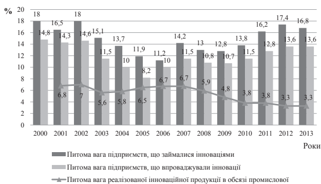
Рис. 1. Інноваційна активність промислових підприємств протягом 2000–2013 років, % [9]

1) протягом 2000–2013 років питома вага підприємств, що займалися інноваціями, скоротилася на 1,2% з 18% – у 2000 році до 16,8% – у 2013 році. У 2013 р. інноваційною діяльністю у промисловості займалися 1715 підприємств, або 16,8% (у 2012 р. – 1758, або 17,4%). На технологічні інновації 1337 підприємств витратили 9,6 млрд грн (у 2012 р. – 1362 підприємства і 11,5 млрд грн) [9];