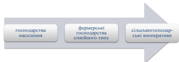
Рис. 2. Схема розвитку дрібнотоварного сільськогосподарського виробництва на основі визнання сімейного типу господарювання

Державна політика щодо стимулювання розвитку дрібнотоварного сільськогосподарського виробництва в Україні повинна ґрунтуватися насамперед на вирішенні питання подальшого функціонування господарств населення. Важливу роль у цьому має відігравати визнання сімейного типу господарювання (передусім у вигляді фермерського господарства) невід'ємною складовою перспективної моделі вітчизняного аграрного сектору [8]. При цьому заходи державної підтримки мають спрямовуватися на посилення організаційно-економічної допомоги в створенні та функціонуванні фермерських господарств сімейного типу з подальшим їх об'єднанням у сільськогосподарські кооперативи за схемою, наведеною на рисунку 2: