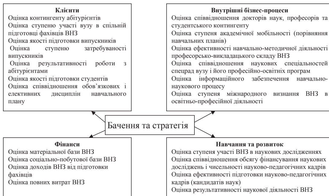
Рис. 1. Узагальнена схема збалансованої системи показників освітніх послуг ВНЗ

Розглянемо особливості використання методів оцінювання якості освітніх послуг: