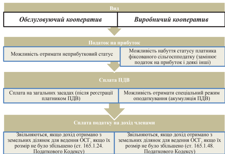
Рис. 3. Різниця в оподаткуванні обслуговуючого і виробничого кооперативу

Відповідно до прийнятих класифікацій та порядку розподілу і списання встановлюється порядок ведення доходів і витрат. Відповідно до п. 17 П(С)БО 15 «Дохід», «Отримане цільове фінансування визнається доходом протягом тих періодів, у яких були зазначені витрати, пов'язані з виконанням умов цільового фінансування». Стосовно витрат, то, відповідно до п. 11 П(С)БО 16 «Витрати», організації мають встановлювати їх самостійно. Правила бухгалтерського обліку й надалі залишаться незмінними [9]. Зважаючи на специфіку діяльності неприбуткових організацій, особливо благодійних фондів, треба зазначити обов'язкове використання рахунків 92 та 949 з ме-