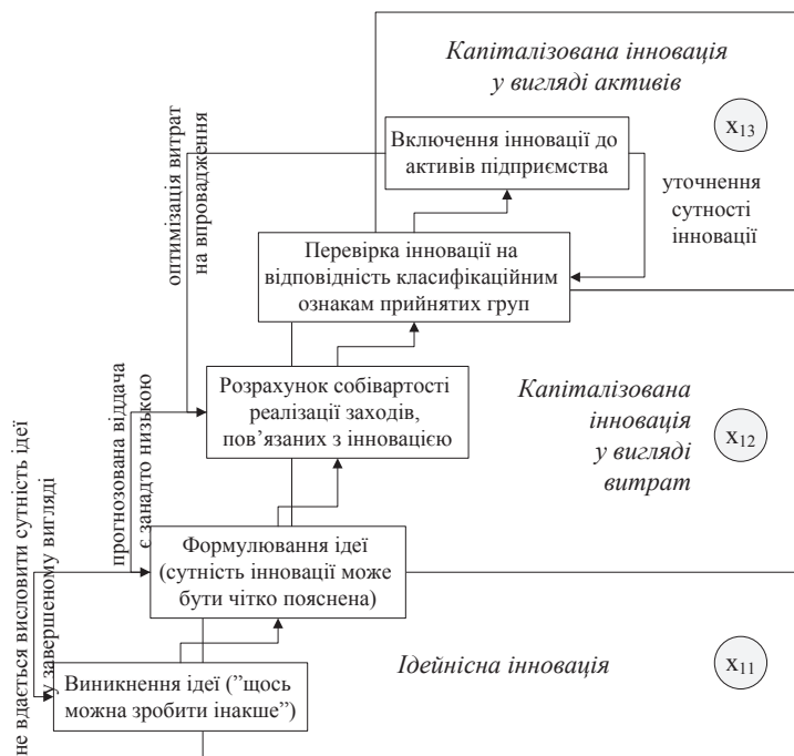
Рис. 2. Види інновацій за стадією капіталізації

Ідейнісна інновація, як початок еволюції інновації, не є активом підприємства, оскільки ще не представлена у матеріальному вигляді (не має чіткої аргументації та вираження), проте підприємство накопичує витрати, пов'язані з її розробкою. У подальшому ідейнісна інновація може бути віднесена до групи активів або витрат, залежно від результативності її практичного впровадження, а може взагалі не бути виділеною окремо (у разі, якщо прогнозована ефективність використання занадто низька). Тобто на дослідження певної ідеї (теорії, стратегії, окремого заходу та ін.) підприємство вже почало витрачати матеріальні та/або нематеріальні ресурси,