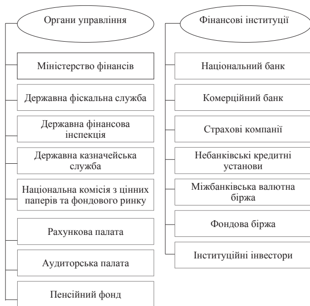
Рис. 1. Організаційна структура фінансової системи України

Фінансова система – один із основних елементів держави, який є показником розвитку, функціонування та ефективності державної політики. Реформування фінансів, обумовлене переходом до ринкової економіки, є досить складним, тривалим та суперечливим процесом. Фінансова система – сукупність різноманітних видів фондів фінансових ресурсів, які є у розпорядженні держави. Вона складається із внутрішньої будови та організаційної структури. Внутрішня будова складається із сфер та ланок, і представлена такими складовими: державні фінанси, фінанси суб'єктів господарювання, міжнародні фінанси, фінансовий ринок (забезпечуюча сфера). До складу організаційної структури входять органи управління у сфері бюджету, контрольно-регулюючі, фінансові інститути та цільові фонди (рис. 1).