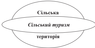
Рис. 1. Взаємозв'язок сільського туризму і сільської території

ний за умов стійкої, системної та цілеспрямованої співпраці всіх зацікавлених сторін – суб'єктів туристичного підприємництва, органів влади та місцевого самоврядування та інших, тобто процесу структуризації економічних відносин та створення формальних інститутів взаємодії (громадських організацій, кластерів, асоціацій тощо) у сфері сільського туризму. На нашу думку, сільський туризм доповнює розвиток сільських територій (рис. 1).