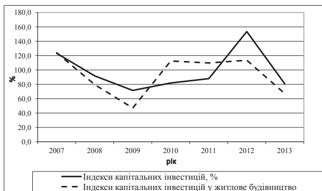
Рис. 2. Динаміка індексів капітальних інвестицій Одеської області

Динаміка індексів капітальних інвестицій повторює динаміку абсолютних показників (рис. 2), проте індекс капітальних інвестицій з огляду на його комплексність більше підходить для екстраполяції.