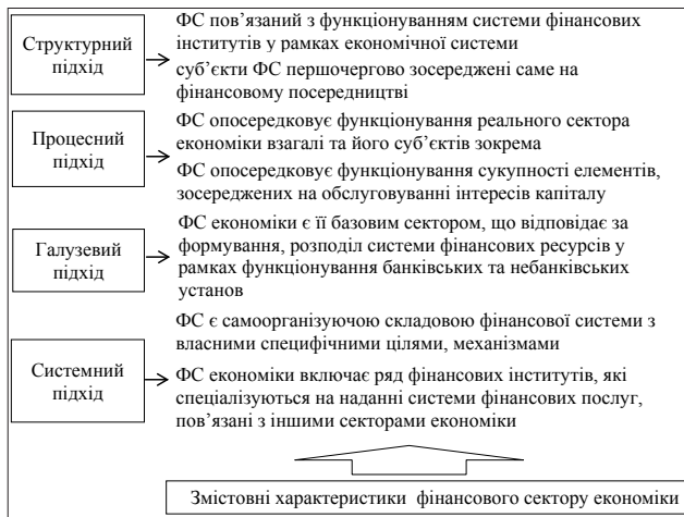
Рис. 1. Система підходів до визначення сутнісних характеристик фінансового сектору економіки [3; 5; 6; 7; 9]

– як безпосередньо складова фінансової системи, обслуговуюча фінанси фінансових посередників [3; 5; 6; 7; 9].