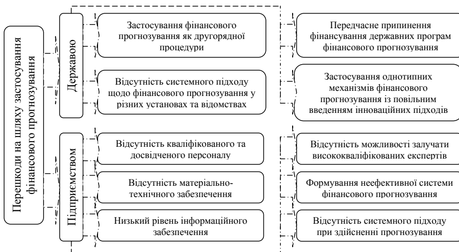
Рис. 3. Перешкоди на шляху застосування фінансового прогнозування в Україні

6. На державному рівні інститут фінансового прогнозування дозволяє узгодити і врахувати тенденції різних сфер економіки, з допомогою чого можливо досягти високого рівня точності фінансових прогнозів, та, підвищити інформаційне забезпечення макроекономічного управління.