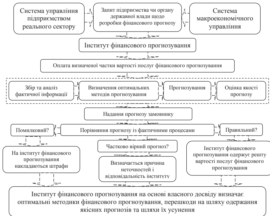
Рис. 4. Алгоритм взаємодії інститутів фінансового прогнозування при взаємодії із економічними суб'єктами

Висновки з даного дослідження. Розглянувши окремі механізми фінансового прогнозування, бачимо, що з їхньою допомогою існує можливість покращити інформаційне забезпечення управління реальним сектором економіки України, проте ефективність його застосування залежить від безлічі обставин, що значно ускладнює процес формування якісних прогнозів. У зв'язку з цим особливо актуальними є залучення інститутів фінансового прогнозування, здатних послідовно та ґрунтовно підходити до процесів прогнозування. З огляду на розглянуті переваги інститутів фінансового прогнозування, варто зазначити, що їх розвиток дозволить акумулювати необхідні досвід та знання щодо ефективних шляхів формування якісних прогнозів, а також залучити необхідні матеріально-технічні ресурси для максимально ефективного застосування наявних підходів до прогнозування. Стимулювання діяльності таких інститутів є особливо важливим в реальному секторі економіки, оскільки він є фундаментальною основою всієї економіки, який відчуває постійну нестачу фінансо-