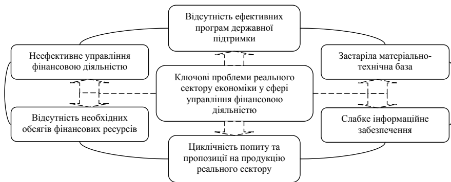
Рис. 1. Ключові проблеми реального сектору економіки України у сфері управління фінансовою діяльністю

Зазначені проблеми управління фінансовою діяльністю в реальному секторі економіки негативно впливають на його продуктивність та здатність стабільно розвиватись. Так, неефективне управління суб'єктами реального сектору економіки України на мікроекономічному рівні поєднується з відсутністю ефективної державної підтримки на макроекономічному рівні, у зв'язку з чим наявні в національній економіці незначні фінансові ресурси розподіляються та використовуються неефективно, що призводить до розвитку негативних тенденцій та завдає шкоди загальній економічній ситуації. Налагодження якісного управління на мікро- та макроекономічному рівнях дозволить оптимально розподілити фінансові ресурси та реалізувати наявний потенціал. Необхідно розуміти, що важливим факто-