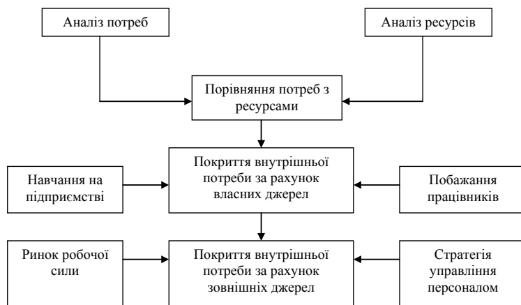
Рис. 1. Процес прогнозування компетенцій

Методологія комплексного підходу до стратегічного управління персоналом,