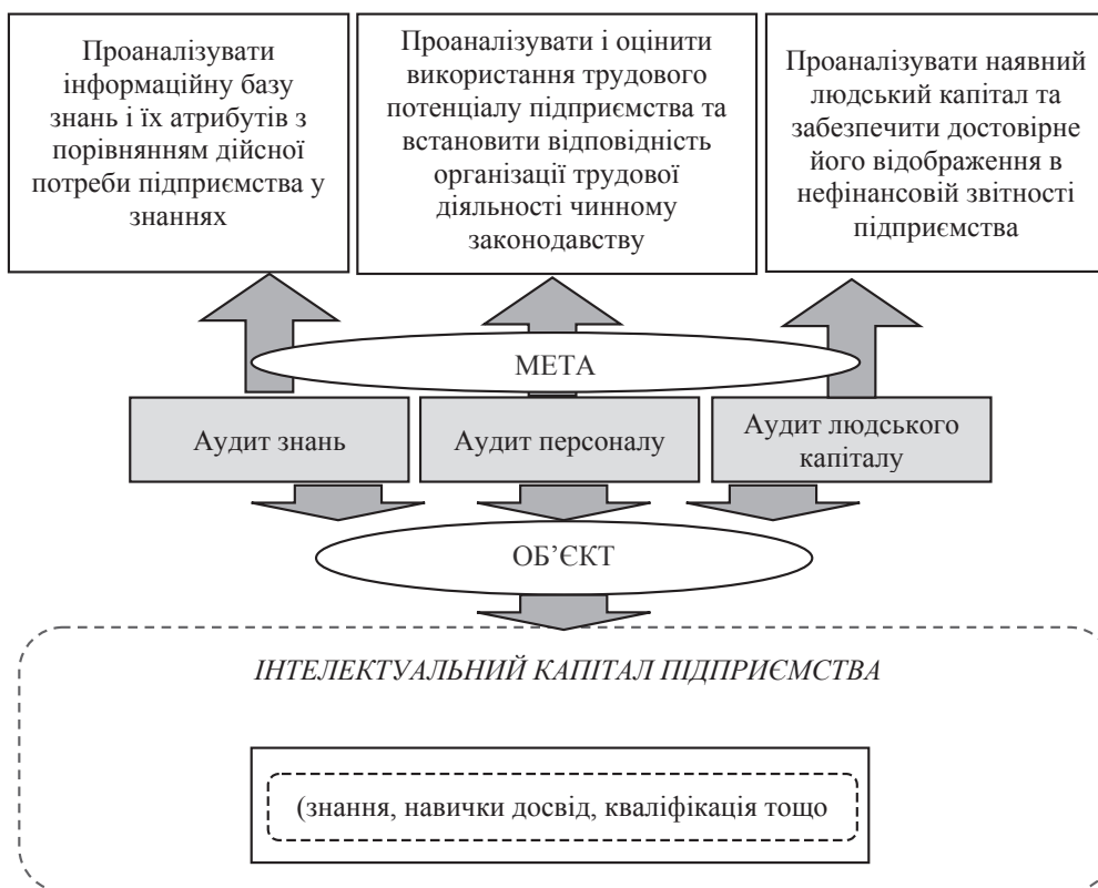
Рис. 2. Об'єктно-цільове спрямування видів аудиту інтелектуального капіталу