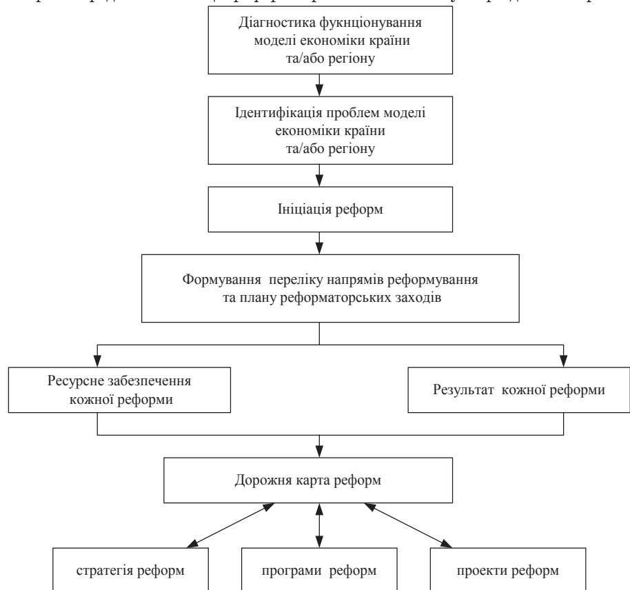
Рис. 1. Концептуальний підхід до реалізації реформ у країні та її регіонах

Виклад основного матеріалу. Загальновідомо, що реформи розпочинаються у періоди загострення