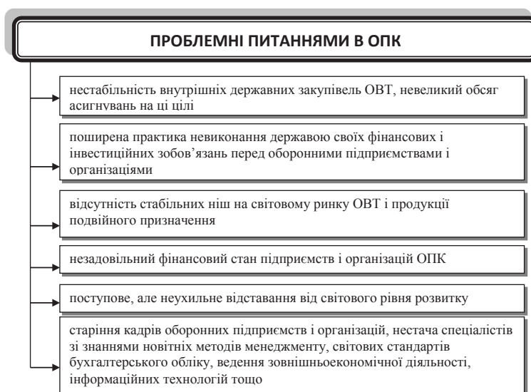
Рис. 1. Проблемні питаннями в ОПК

Виклад основного матеріалу дослідження. Досягнення і збереження позитивних темпів зростання економіки дає підстави для прогнозу збільшення в найближчій перспективі внутрішнього інвестиційного потенціалу і перерозподілу його на користь високотехнологічних галузей промисловості, росту місткості внутрішнього ринку продукції тривалого споживання, ринку технологіч-