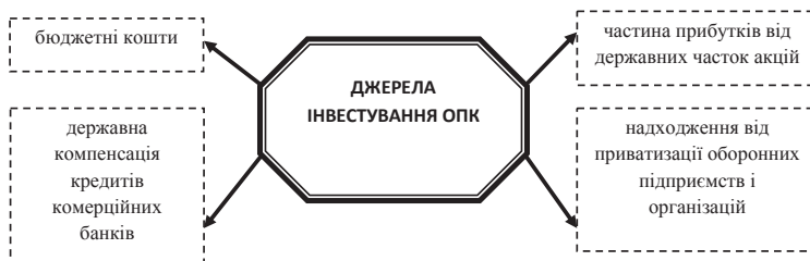
Рис. 4. Джерела інвестування ОПК