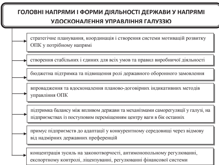
Рис. 3. Головні напрями і форми діяльності держави у напрямі удосконалення управління галуззю