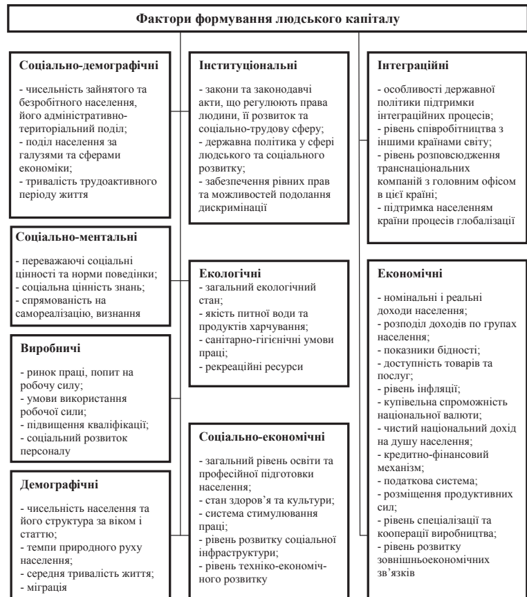
Рис. 1. Групи факторів формування людського капіталу

На нашу думку, формування людського капіталу потрібно досліджувати як процес пошуку, віднов-