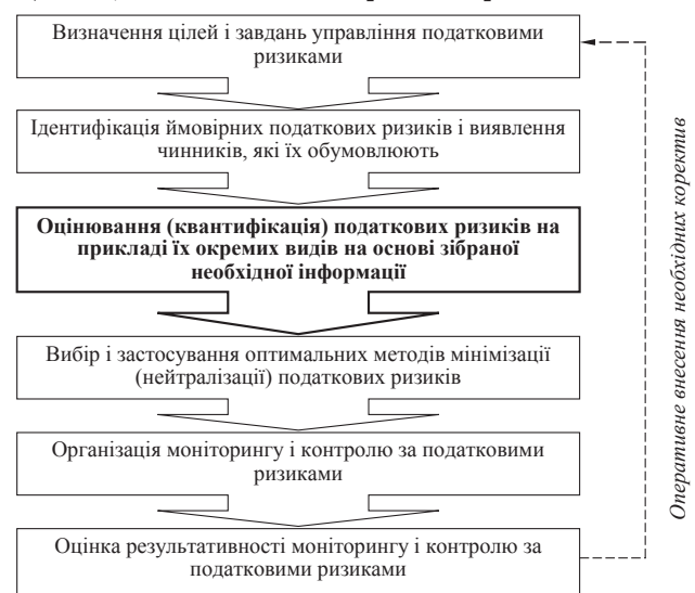
Рис. 1. Послідовність реалізації процесу управління податковими ризиками суб'єктів підприємницької діяльності

теру шкоди вказаним способом базується на припущеннях, воно також має вартісне вираження.