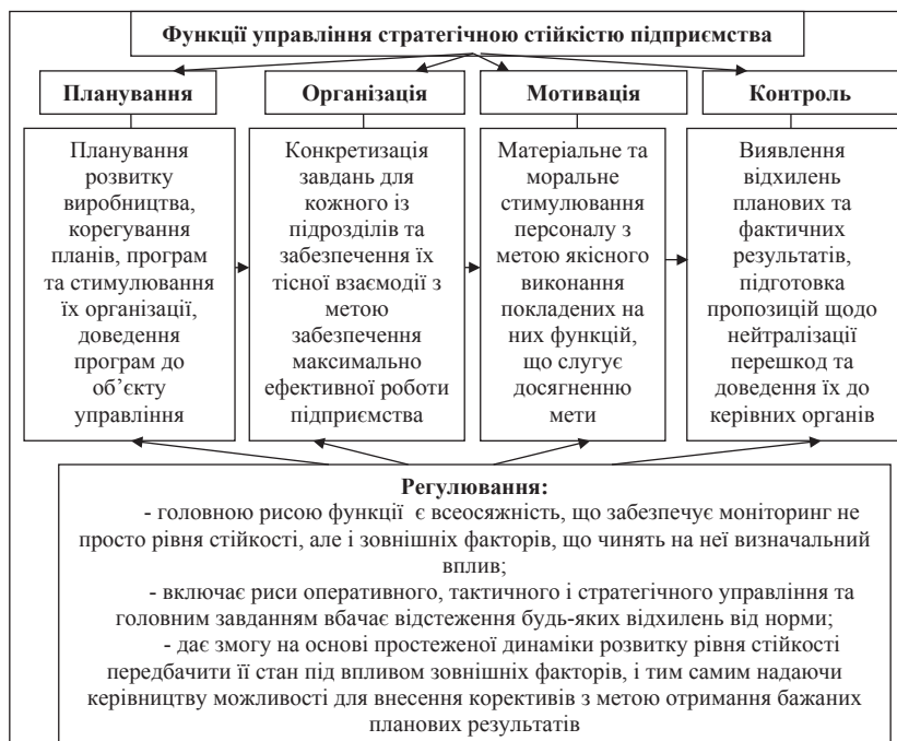
Рис. 1. Функції управління стратегічною стійкістю підприємства Авторська розробка на основі [5]