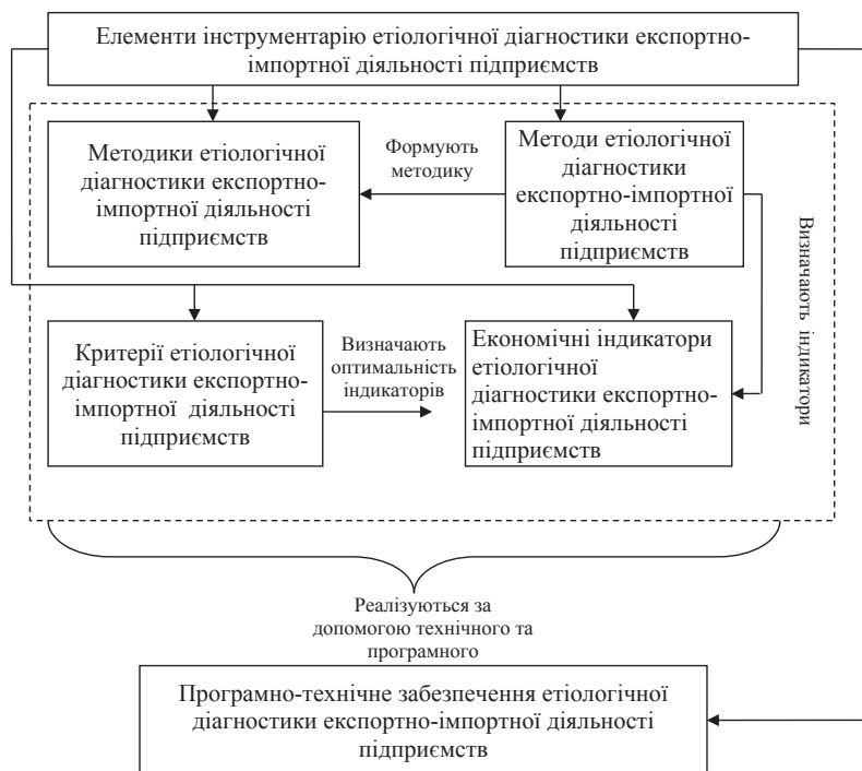
Рис. 1. Структура взаємозв'язків між елементами інструментарію етіологічної діагностики експортно-імпорتنної діяльності підприємств

З метою оптимізації процедури вибору методів етіологічної діагностики експортно-імпорتنної діяль-