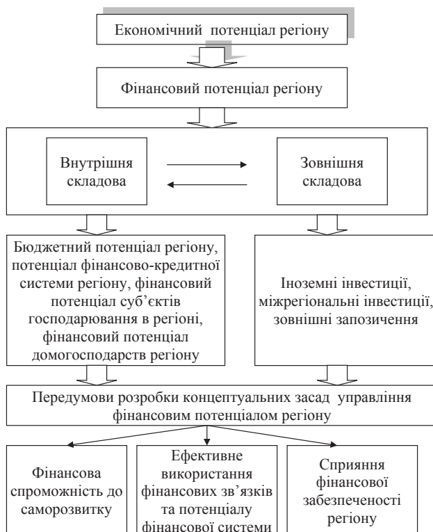
Рис. 2. Фінансовий потенціал в системі забезпечення фінансового управління регіону [3]

Існує значна кількість обґрунтованих методів розрахунку фінансового потенціалу: вартісної оцінки його елементів (нормативний (індикативний), індексний, ресурсно-регресійний), пріоритетної оцінки ресурсів тощо. Для кожного методу притаманні як позитивні, так і негативні сторони залежно від об'єкту дослідження умов його діяльності.