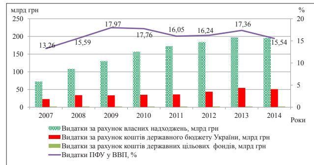
Рис. 1. Динаміка складу витратків Пенсійного фонду України за 2007–2014 рр., млрд. грн.

Важливим показником оцінки фінансової спроможності пенсійної системи країни є співвідношення пенсійних витрат і валового внутрішнього продукту. Частка витратків бюджету Пенсійного фонду України у валовому внутрішньому продукті за наведений період збільшилась на 2,28 відсоткових пункти, що є негативним явищем, середня величина цього показника становила 16,21%. Зазначимо, що обсяг пенсійних витратків за співвідношенням з валовим внутрішнім продуктом досяг найвищого розміру у світі. При цьому не було здійснено ефективних заходів, спрямованих на збільшення власних надходжень пенсійної системи.