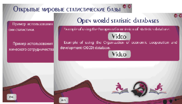
Рис. 2. Слайд з можливістю перегляду відеоматеріалу

Для оптимізації використання технічних ресурсів відеоматеріали було збережено окремо від аудіодоріжок, тому при зміні мови відеоматеріалу було забезпечено перехід до відповідного аудіосупроводу (рис. 2).