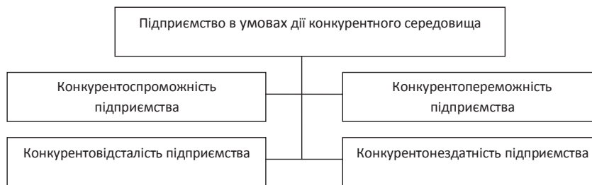
Рис. 2. Класифікація термінів, що характеризують конкурентну діяльність підприємства.