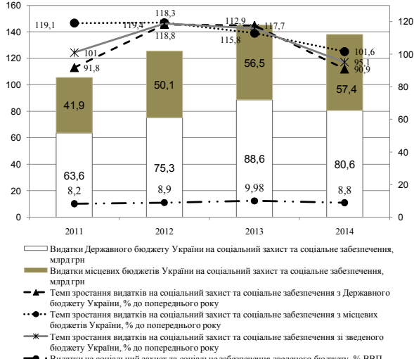
Рис. 1. Динаміка та структура видатків Державного та місцевих бюджетів України за статтею «Соціальний захист та соціальне забезпечення» протягом 2011–2014 рр.

співвідношенні 1,5:1. Незначне зрушення в бік збільшення фінансування таких видатків з місцевих бюджетів відбулося у 2014 р., частка яких в структурі видатків соціального захисту і соціального забезпечення Зведеного бюджету склала 41,6%, попри 39–40% у 2011–2013 рр. Незважаючи на більшу частку видатків, що спрямовуються на потреби соціального захисту з Державного бюджету, слід відмітити нижчі темпи їх нарощення порівняно із темпами нарощення однойменних видатків з бюджетів місцевого самоврядування. Так,