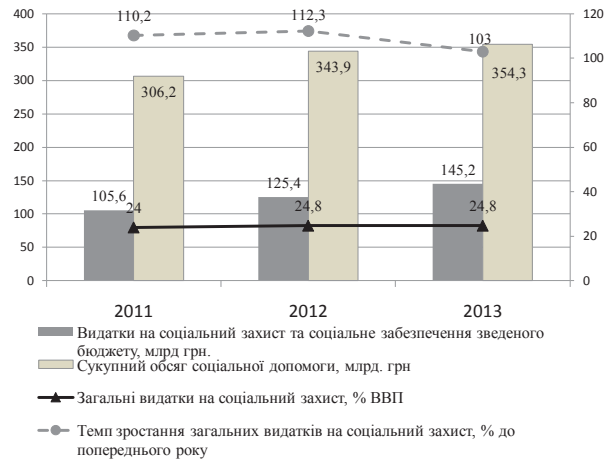
Рис. 3. Загальні витатки на соціальний захист (з урахуванням усіх джерел фінансування) та витатки на соціальний захист і соціальне забезпечення Зведеного бюджету України у 2011–2013 рр.

фінансування) у 2,5–3 рази перевищує ту суму, що проходить у Зведеному бюджеті України за видатковою статтею «Соціальний захист та соціальне забезпечення», і становить у 2013 р. 361,2 млрд грн,