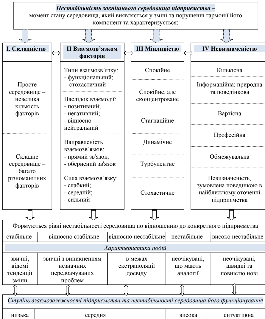
Рис. 1. Взаємозв'язок характеристик нестабільності зовнішнього середовища та підприємства

Вважаємо, що сукупність змін факторів зовнішнього середовища та/або дисгармонія його компонент формують певний рівень нестабільності