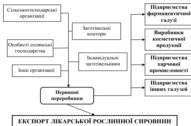
Рис. 2. Структурна схема взаємодії учасників ринку лікарської рослинної сировини в рамках інтеграційного об'єднання

Основними функціями створення та діяльності інтеграційного об'єднання виробників і первинних