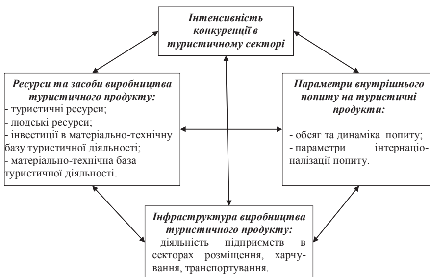
Рис. 1. Система груп параметрів, що описують фактори конкурентоспроможності національного туристичного продукту

На цьому етапі необхідно визначити конфігурацію консервативних сил національного конкурентного поля, під вплив яких підпадають суб'єкти досліджуваного комплексу.