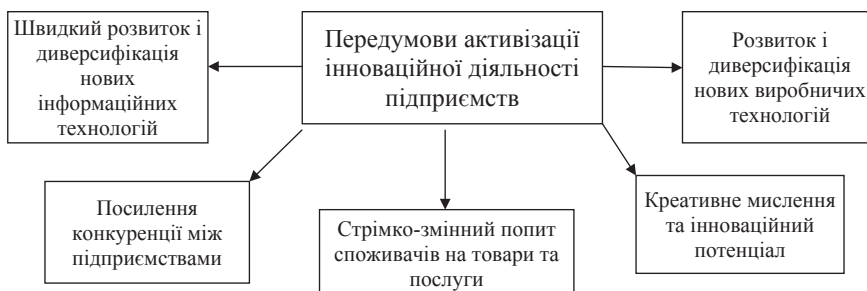
Рис. 1. Фундаментальні передумови активізації інноваційної діяльності підприємств

- формування якісно нової організації взаємозв'язків і взаємодії між усіма учасниками інноваційного процесу, встановлення нових функцій за відповідними органами управління як на державному, так і регіональному рівнях;