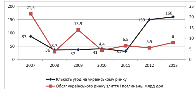
Рис. 2. Динаміка процесів злиття і поглинання в Україні

Джерело: Thomson Reuters. Preliminary Mergers & Acquisitions Review [Електронний ресурс] // Thomson Reuters. – Режим доступу : http://blog.thomsonreuters.com/index.php/preliminary-mergers-acquisitions-review-fy-2013/ (дата звернення: 03.02.2015).