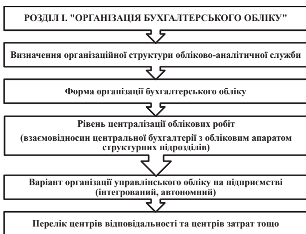
Рис. 3. Організація бухгалтерського обліку

Вибір форми організації обліку залежить від розміру підприємства. Малі підприємства можуть не мати бухгалтерської служби (відділу) або бухгалтера, а облік на них може вести керівник, власник або залучений фахівець.