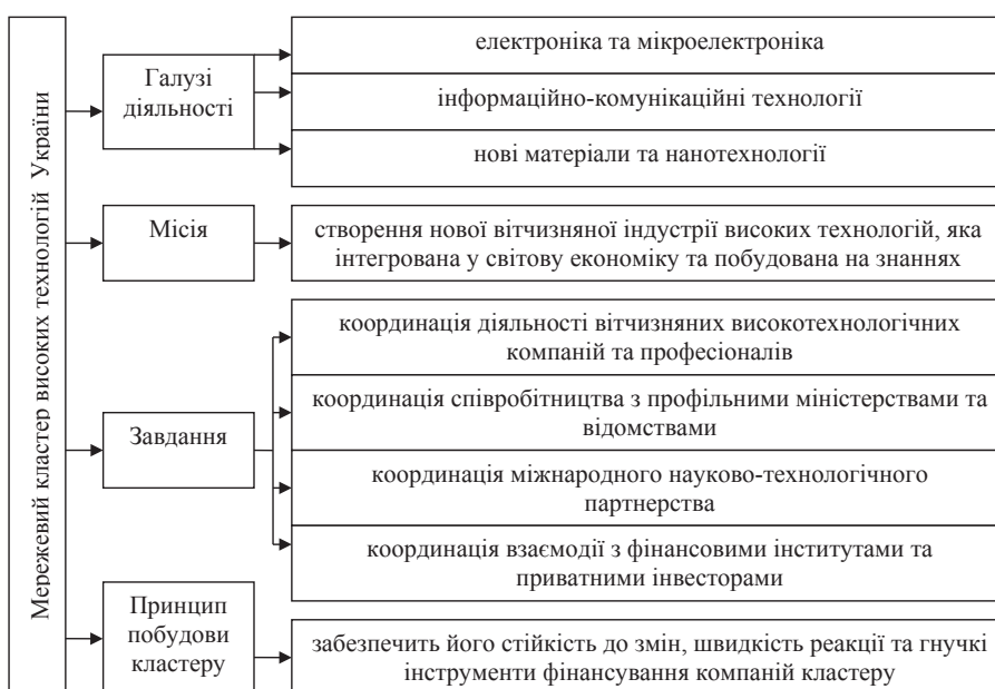
Рис. 2. Формування Мережевого кластера високих технологій України

За принципами UA.RPA кінцевою продукцією не обов'язково має бути матеріальний продукт. Це можуть бути алгоритми, досвід, підготовлений під конкретний про-