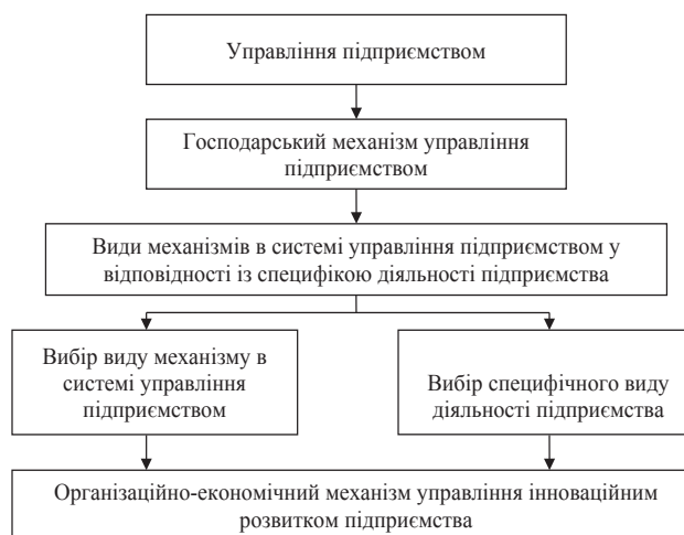
Рис. 1. Формування організаційно-економічного механізму управління інноваційним розвитком підприємства

На наш погляд, організаційно економічний механізм управління інноваційним розвитком підприємства представляє собою конкретний методико-прикладний аспект формування і реалізації процесу