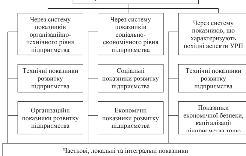
Рис. 4. Основи опосередкованого методу оцінки інноваційного розвитку підприємства