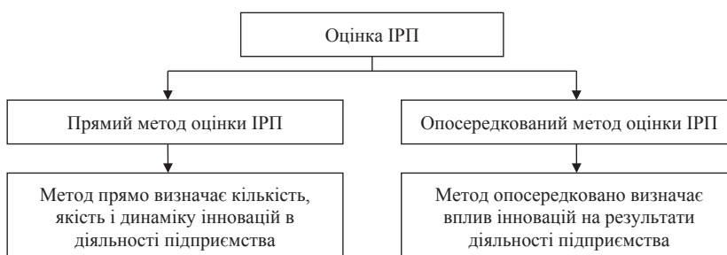
Рис. 3. Основи оцінки інноваційного розвитку підприємства