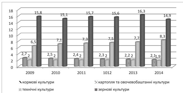
Рис. 3. Динаміка посівних площ упродовж 2009–2014 рр., млн га [8]

Варто зазначити, що більшість культур вирощується на сільськогосподарських підприємствах (не включаючи овочі та картоплю), тому зміна обсягів виробництва зумовлена скороченням земель, що входять до їх складу, у 2014 році на 1,2 млн га (-5%) порівняно з 2010 роком. Серед зернових культур скорочення посівних площ спостерігалось таке: пшениця – 550 тис. га (-11%), жито – 128 тис. га (-54%) та ячмінь – 1,2 млн га (-40%), тоді як посіви під кукурудзою на зерно зросли на 1,6 млн га (+76%). Серед технічних культур збільшення посівних площ спостерігається у виробництві соняшнику – на 610,4 тис. га (+17%) та сої – на 662,1 тис. га (+65%), ріпак зазнав незначного зменшення на -1%.