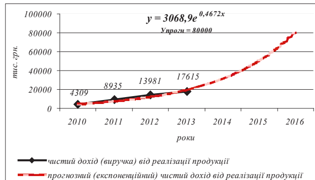
Рис. 1. Фактичні і прогнозовані рівні чистого доходу (виручки) від реалізації продукції (товарів, робіт, послуг)

Для прогнозування основних показників фінансових результатів у досліджуваному господарстві використано статистичний пакет аналізу даних в Excel. В якості аргументів статистичної функції РОСТ, яка обчислює експоненційну апроксиманту даних кривих, використано числові значення чистого доходу від реалізації продукції, валового прибутку, прибутку від операційної діяльності і чистого прибутку за 2010–2013 рр.