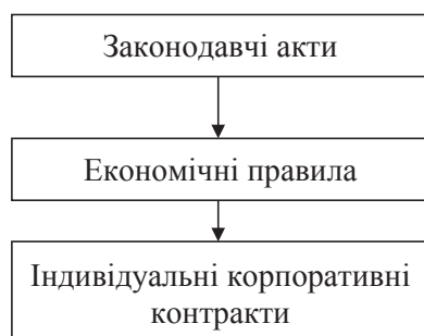
Рис. 2. Інституціональна структура корпоративного ринку України

В Україні інститути регулюють внутрішній рух корпоративного капіталу. Формальні інститути можна представити у вигляді трирівневої структури (рис. 2).