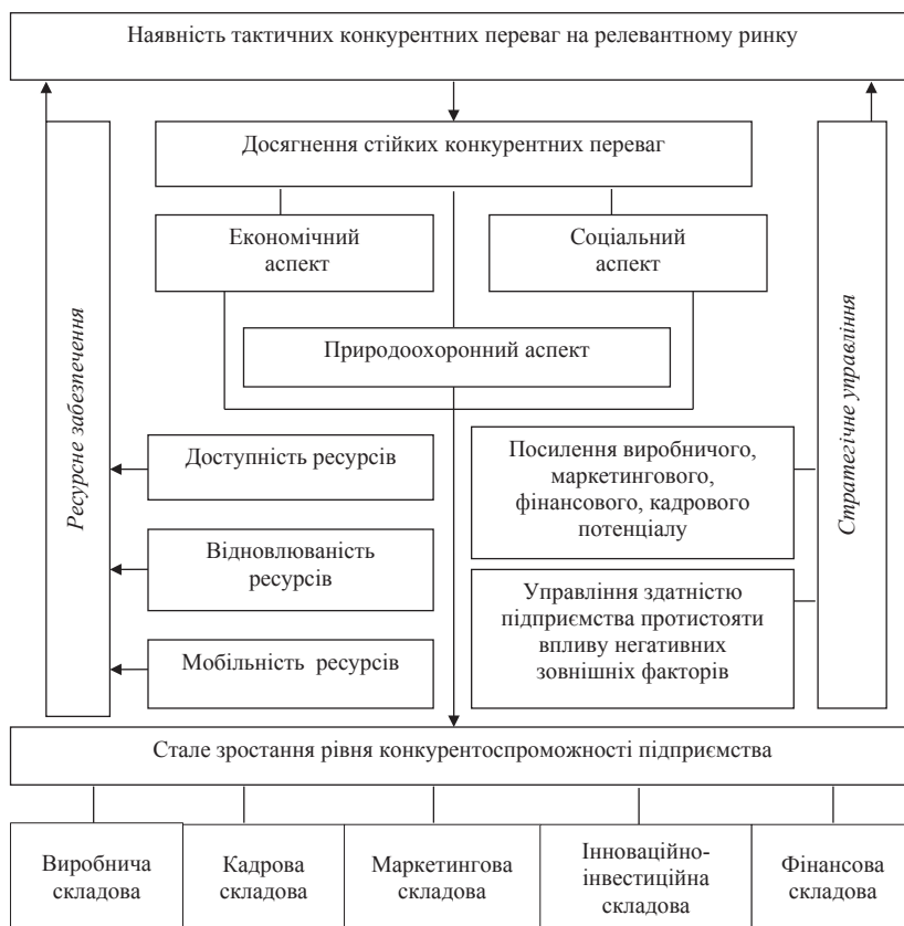
Рис. 1. Формування стійких конкурентних переваг підприємства у межах трьох компонент сталого розвитку