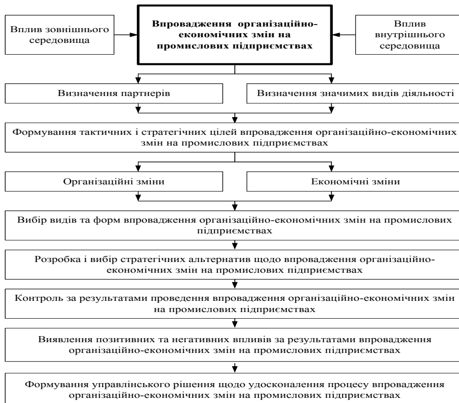
Рис. 2. Механізм формування управлінського рішення щодо вдосконалення процесу впровадження організаційно-економічних змін на промислових підприємствах

Цільова і ресурсна ефективність характеризує ефективність поточного процесу