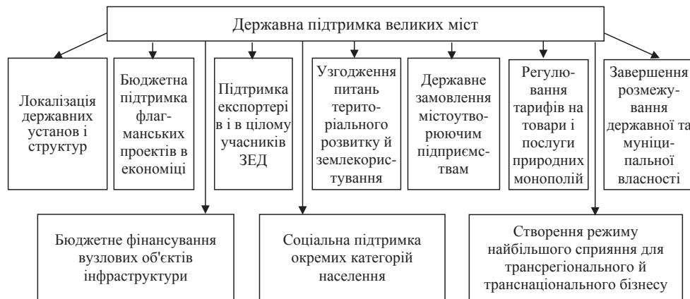
Рис. 2. Основні напрями державної підтримки розвитку великих міст із урахуванням фактора глобалізації

рівнях (у провідному місті українського Півдня – Одесі, незважаючи на статус муніципалітету-донора, безоплатні перерахування з обласного бюджету в складі дохідних джерел становлять 30-40%).