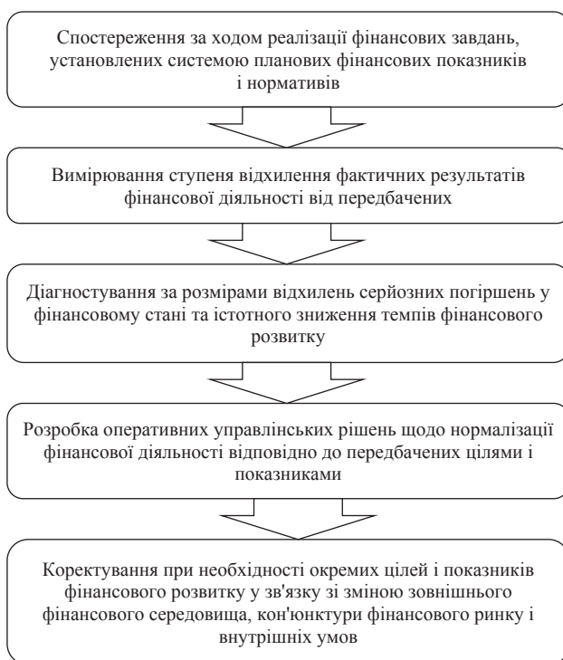
Рис. 2. Основні функції фінансового контролінгу

Функції фінансового контролінгу можна визначити за його метою, якою є діагностування фінансового стану, визначення тенденції економічного розвитку та запобігання впливанню негативних факторів на розвиток підприємства. Універсальними для всіх видів контролінгу є такі функції: інформування, планування, контроль, управління, координування, адаптація та прогнозування. Щодо основних функцій фінансового контролінгу, то можна виділити наступні (рис. 2)