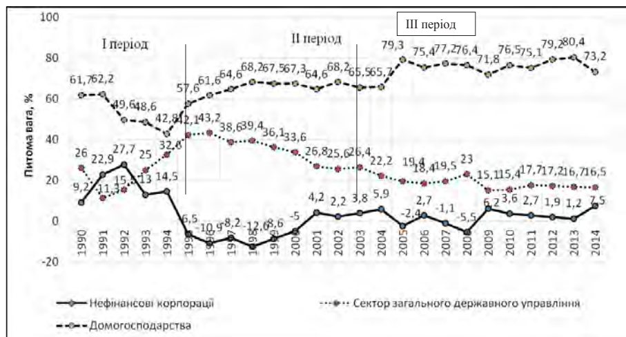
Рис. 1. Динаміка питомої ваги інституційних секторів економіки України за результатами вторинного розподілу ВНД у 1990–2014 рр.

Було б грубою помилкою, якби ми констатували факт сформованості моделі соціалізації і наявність системи поглядів щодо надання їй більш завершеного вигляду. Для створення методологічної платформи національної моделі звернімо увагу ще на декілька аспектів, що розкривають зміст змін складових ВНД. Принциповим у наведеній практично статичній структурі розподілу ВНД є те, що функціонування подібної моделі забезпечення соціальності у розвитку унеможливорюється із-за низького потенціалу генератора підтримання суспільної динаміки,