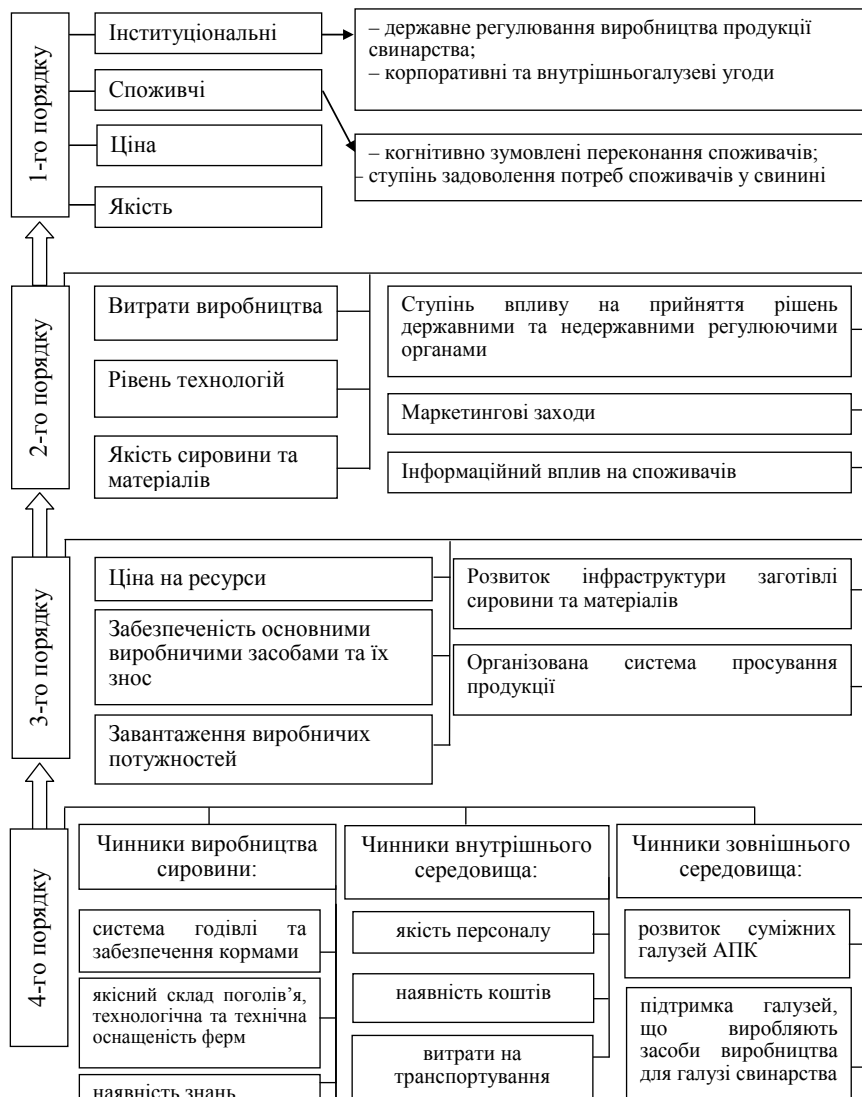
Рис. 2. Класифікація чинників впливу на конкурентоспроможність галузі свинарства

На нашу думку, найбільш важливими факторами впливу на конкурентоспроможність свинини є фактори економічного механізму до яких відносяться ціноутворення, фінансування, кредитування, стимулювання попиту населення на продукцію, експорт продукції тощо. Основою підвищення конкурентоспроможності продукції тваринництва складають фактори державного рівня управління, так як вони визначають рівень добробуту споживачів та їх попит, стратегію розвитку підприємства, регіону і країни в цілому.