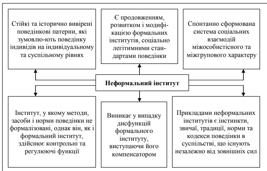
Рис. 1. Сутнісні характеристики неформального інституту (виділені на основі домінуючих підходів інституціональних досліджень)

Дослідження інституціональних трансформацій виявило існування широкого кола витрат, які зумовлюються функціонуванням інституту як механізму впорядкування взаємодії економічних агентів, та включення до спектра трактувань інститутів дослідження їхнього особливого прояву в діапазоні від трансакційних витрат на експлуатацію економічної системи [3, с. 53]; витрат, пов'язаних з пошуком агентом відповідної ціни, організації переговорів та укладанням контрактів;