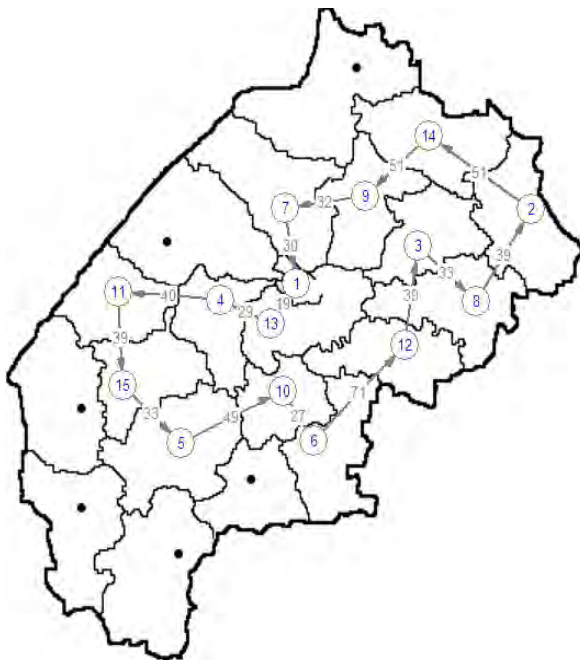
Рис. 3. Маршрут доставки за критерієм мінімізації відстаней

значну кількість параметрів, що залежать від пройденого шляху. Зокрема, одним із важливих факторів при побудові маршруту, є якість транспортних шляхів, що впливає на економічне та безпечне перевезення вантажів, оскільки якісні дорожні умови визначають режими роботи транспортних засобів, тобто зменшують амортизацію вузлів та агрегатів. Дорожні умови можна охарактеризувати технічною категорією дороги, видом і якістю дорожнього покриття, рельєфом, тощо. Очевидно, що при перевезенні, наприклад, світлих нафтопродуктів вимоги до транспортування можуть жорстко регламентуватися.