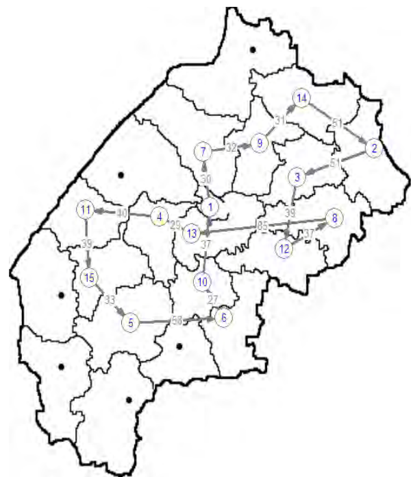
Рис. 4. Маршрут доставки з урахуванням пріоритетності шляхів

Маючи дані про відстані між складами підприємства, а також середні швидкості руху по цих ділянках, можна оптимізувати маршрут з урахуванням середньої швидкості руху, а також розглядати задачу побудови маршруту доставки як динамічну, з урахуванням зміни дорожніх умов [7].