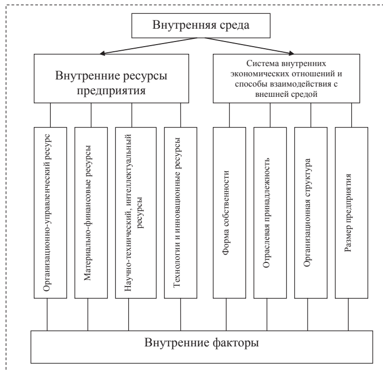
Рис. 1. Внутренние факторы, влияющие на инновационную активность

К числу внешних факторов можно отнести: использование внешних источников для реализации всех фаз