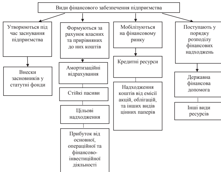
Рис. 1. Види фінансового забезпечення підприємства

У разі незадовільної діяльності підприємства, тобто виходу так званої зони стійкого зросту,