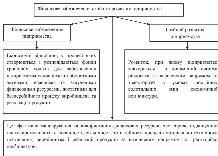
Рис. 3. Фінансове забезпечення стійкого розвитку підприємства