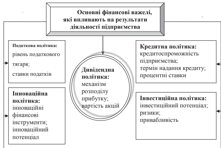
Рис. 1. Фінансові важелі, які впливають на результати діяльності підприємства

Необхідно констатувати, що стан підприємства, його економічні показники залежать як від зовнішніх, так і внутрішніх факторів. До зовнішніх факторів