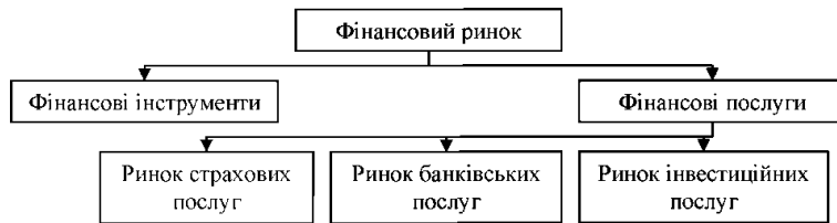
Рис. 1. Структура і місце фінансових послуг на фінансовому ринку

Що стосується України, то з приходом до неї потужного міжнародного фінансового капіталу, передусім у банківський і страховий сектори та на фондовий ринок, на вітчизняному фінансовому ринку активізувалися й інтенсифікувалися процеси інтеграції та конвергенції. Проте сучасна динаміка зовнішньої торгівлі Україною фінансовими послугами свідчить про наявність структурних диспропорцій та