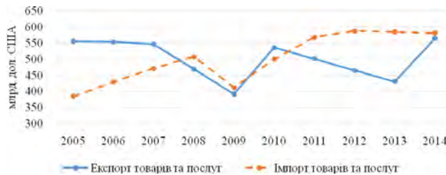
Рис. 1. Динаміка експорту та імпорту товарів та послуг (за методологією платіжного балансу, поточні ціни) [8]

Стосовно географічного розподілу канадського експорту, основним експортним напрямом Канади є