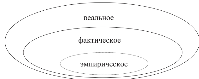
Рис. 1. Онтология критического реализма

всегда ограничено как установками исследователя об изучаемых процессах и явлениях, так и способностью охватить тот ряд событий и ситуаций, которые он может выявить на основе наблюдений и опыта. На уровне фактического (actual) располагаются события положения дел. Они познаются при помощи анализа явлений, происходящих на эмпирическом уровне, но несводимы к чувственным данным. Сама же реальность намного шире и определяется структурной сложностью самих объектов, взаимодействием внутренних сил в этих структурах, причинных законов функционирования структур которые критические реалисты называют общими порождающими механизмами (см. рис. 1).